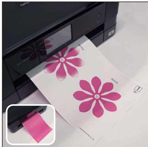
1. 花の展開図をダウンロードして出力する。 ※裏面にも「色柄」を印刷すると、より綺麗な仕上がりに。