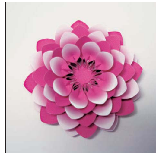
4. 3の花びらの「のりしろ(表)」に糊付けし、aの上にb、bの上にcと順に貼る。 ※花びらは写真のように、交互の位置にくるように貼る。一旦置いておく。