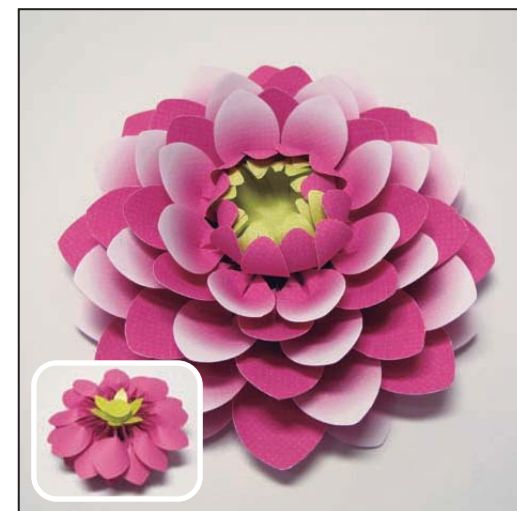
8. 7の茎を花びら a に貼り付けて、形を整えて完成。