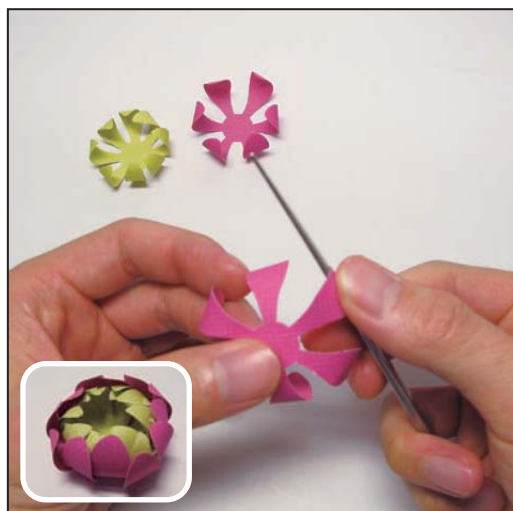
5. 花びら h～l を写真のようにペーパーナイフでカールさせ、hの上にi、iの上にjと順に貼る。