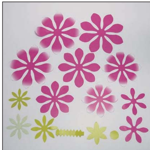
2. 展開図ダリアのカット線を全てカットする。 ※予め、折り線を折り曲げておくと作りやすい。