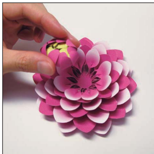
6. 4の花びら g の「のりしろ(表)」の上に、5で作った花びらを貼り合わせる。